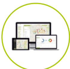
EVIDENČNÉ SYSTÉMY / ELVIS /