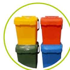
NÁDOBY NA TRIEDENIE ODPADU