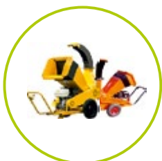
ŠTIEPKOVAČE A DRVIČE